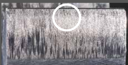
СТОРОНА ВЕДУЩЕЙ ШЕСТЕРНИ