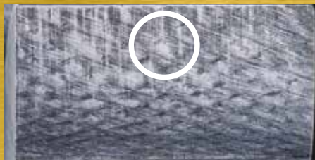
СТОРОНА ВЕДУЩЕЙ ШЕСТЕРНИ